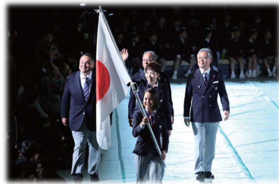
2018平昌冬季オリンピック壮行会