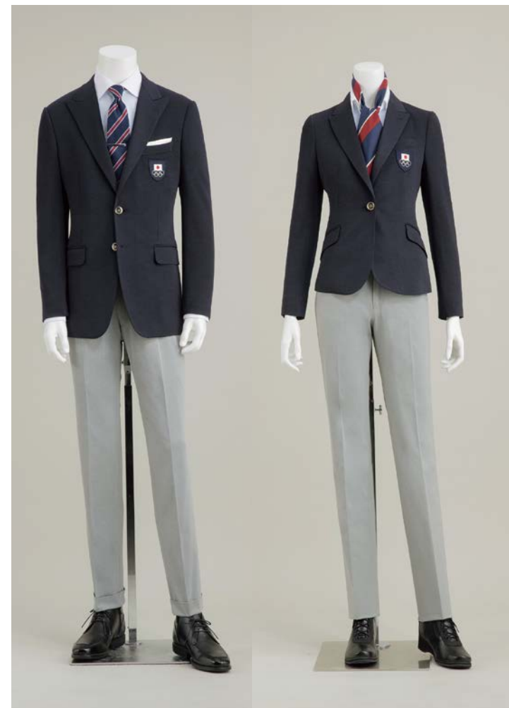
2018平昌冬季オリンピック公式服装（式典・渡航服）参考 AOKI社作成